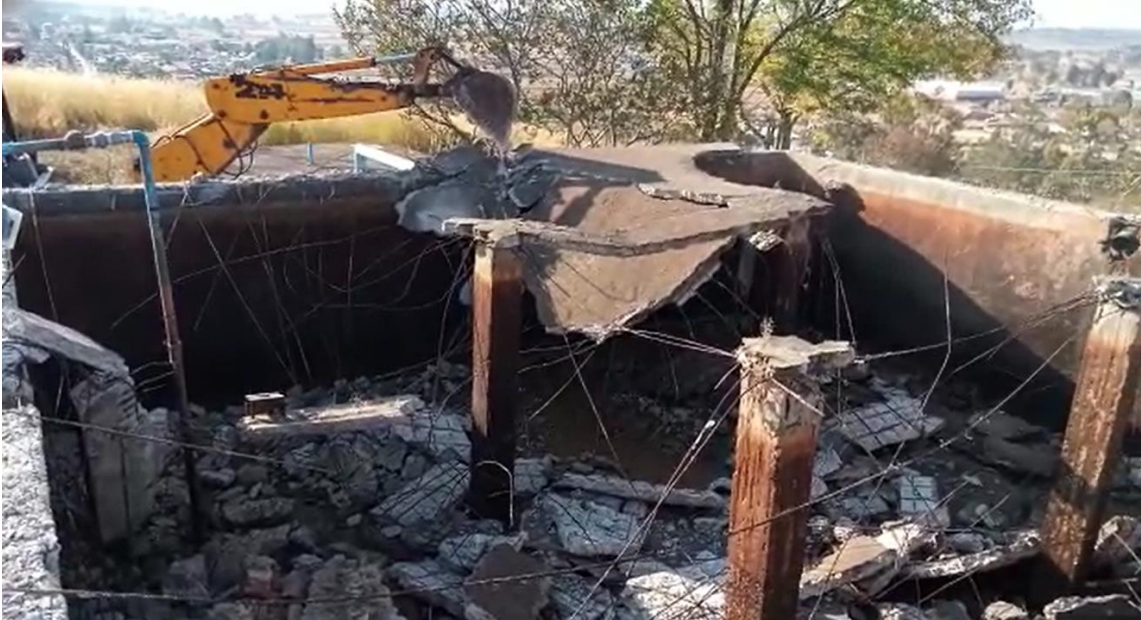
DEMOLICION DE MEMBRANA DAÑADA